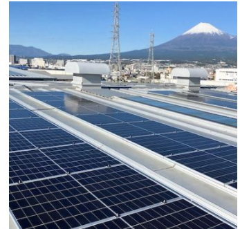
(エコネコル富士工場屋根)

2024 年 6 月末時点で、エンビプログループ全体で使用する再生可能エネルギー電力の割合は約 96%と、2050 年までの目標に向けて着実に RE100 への取り組みを進めています。